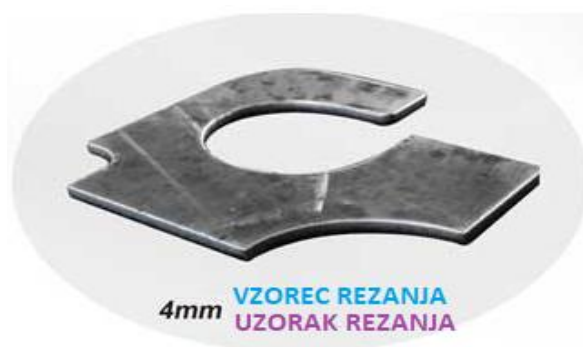
4mm VZOREC REZANJA UZORAK REZANJA