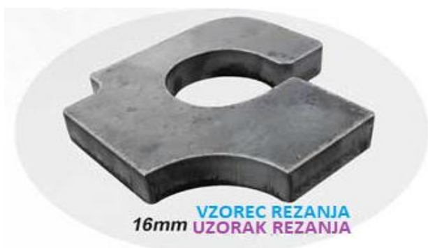
16mm VZOREC REZANJA UZORAK REZANJA

CNC STROJ, PLAZMA REZALNIK VISOKIH ZMOGLJIVOSTI ! CNC MAŠINA, PLAZMA REZAČ VISOKIH PERFORMANSI !