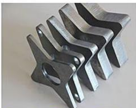
Rezanje ogljikoveg jekla - inox Rezanje ugljeničnog čelika - rostfrei

Uglavnom se koristi za rezanje metalnih ploča kao što su nehrđajući čelik, ugljični čelik, pocinčana ploča, razne legure, kao i ostali metali sve osim lijevanog železa.