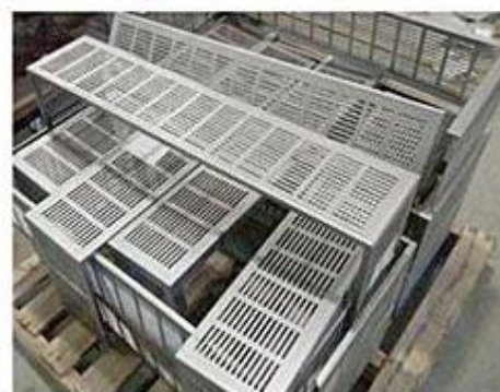
Splošna obdelava pločevine rezanjem Opšta obrada lima rezanjem