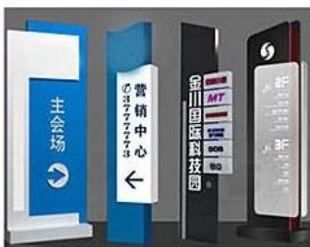
Različni informacijski predmeti Razni informacijski predmeti