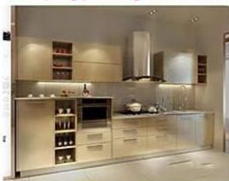
Kuhinjski Inox predmeti posode Kuhinjski Inox predmeti, posode itd