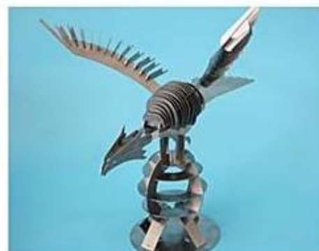
Kovinski predmeti, različne oblike Metalni predmeti različnih oblik